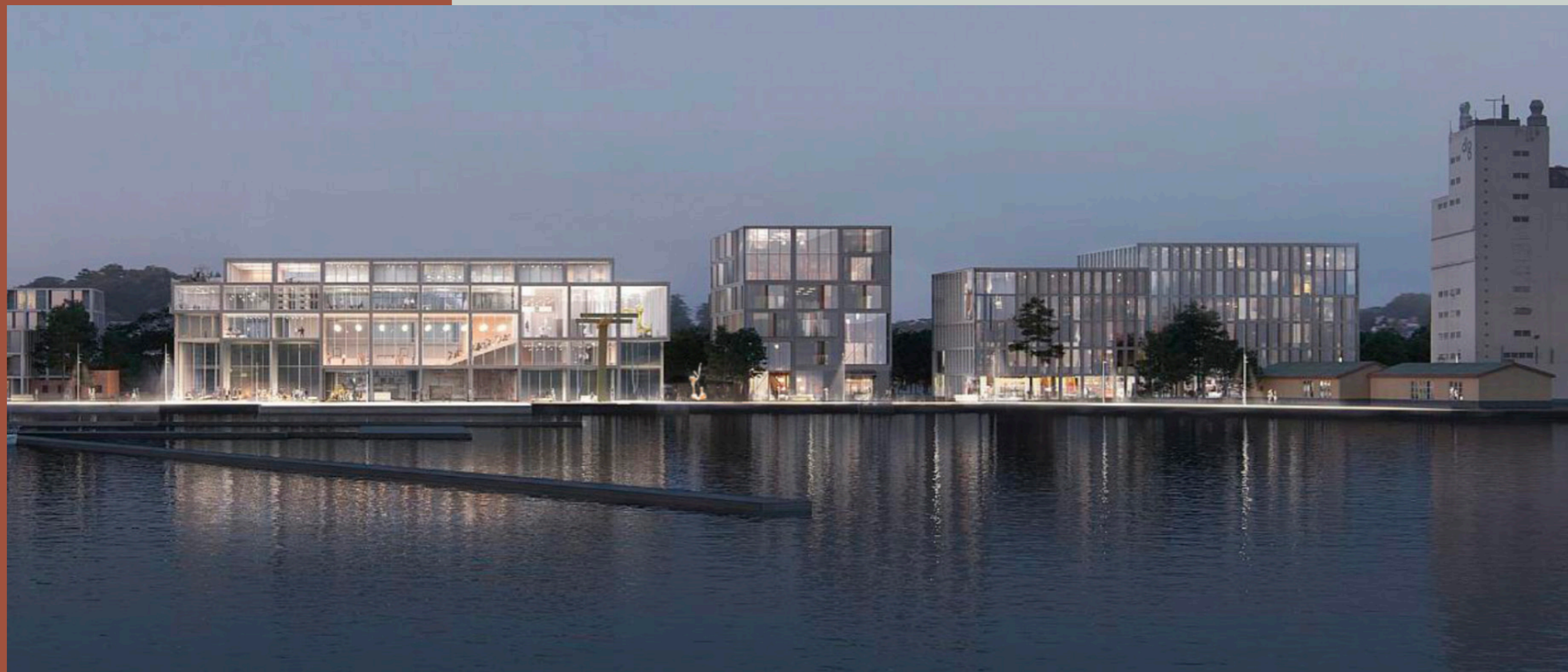
Visualisering af en "Bronze Pour" skulptur af kunstnergruppen A Kassen på Nordre Kaj