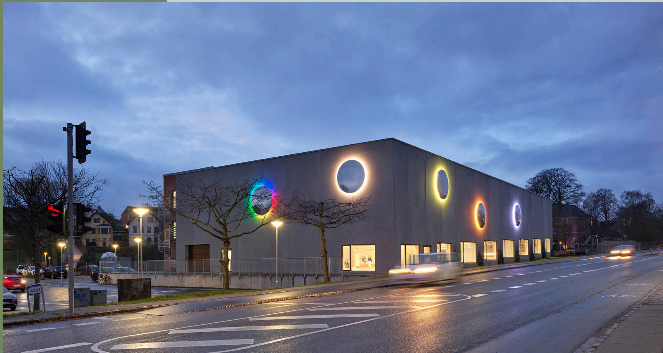
Viera Collaro, De 5 Planeter , 2022, Haahrs Skole, Svendborg