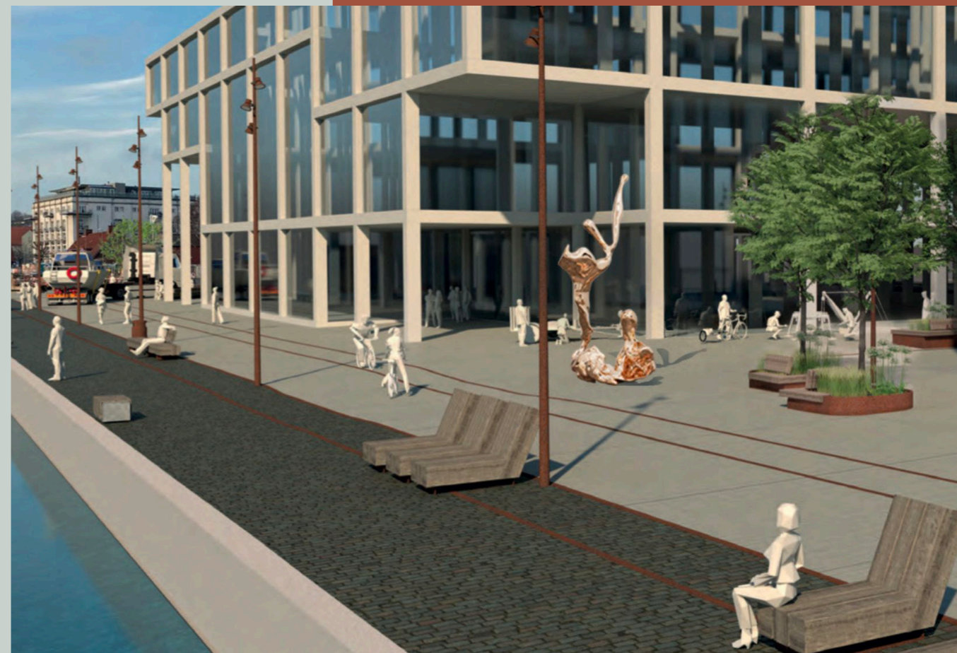
Værkeksempel: Visualisering af kunstværk mellem SIMAC og SME af kunstnergruppen A Kassen

På Nordre Kaj forenes den historiske rå havnekaj med innovative maritime virksomheder, erhvervsfolk og unge studerende fra både SIMAC og UCL, der alle skal være med til at forme byens fremtid. Områdefornyelsen på Nordre Kaj er i slutningen af anlægsfasen. Projektet tager udgangspunkt i samme designprincipper, som den første etape på Frederikshavn og der er taget udgangspunkt i områdets karakter i valget af materialer, der er robuste og havnespecifikke med fx brosten, beton, metal og træ, hvilket blødes op af områder med træer og bænke, som skaber små grønne oaser på den rå havnekaj. Nordre Kaj markerer nu overgangen mellem det rekreative område med den nye havnepark og industrihavnen på Østre Kaj.