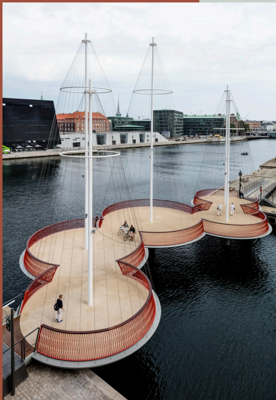
Olafur Eliasson, Cirkelbroen , 2015, Christianhavnskanal, København