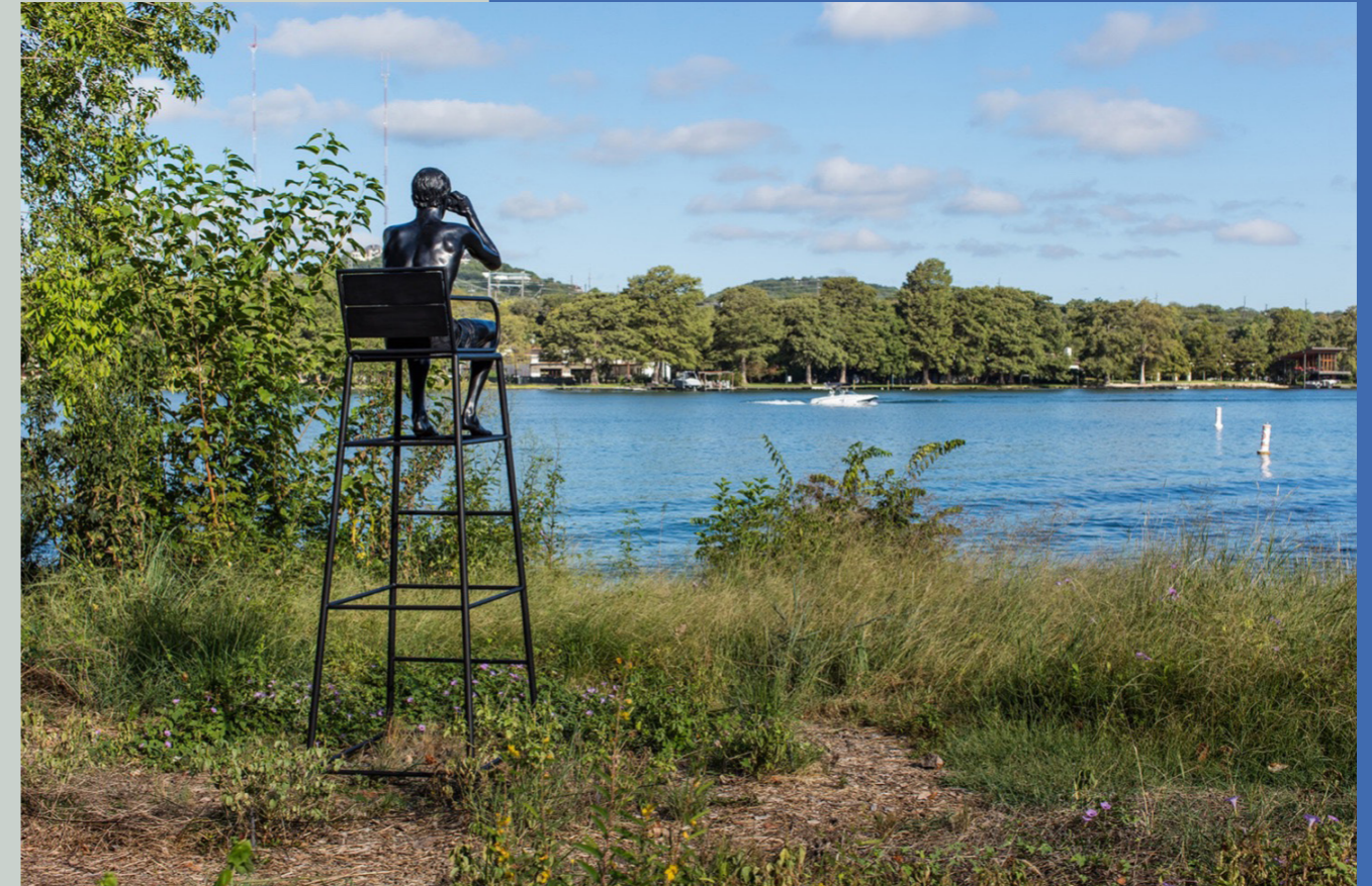
Elmgreen & Dragset, Watching , 2017, Austin, The Contemporary

Den kunstneriske kvalitet vægtes højt i arbejdet med kunst på Den Blå Kant, og ambitionen er derfor at invitere anerkendte og erfarne kunstnere fra den danske kunstscene til at skabe værker til området. Det er komplekst at arbejde med kunst i det offentlige rum og derfor vil det være en fordel at arbejde med kunstnere, der har forståelse for og erfaring med kunstprojekter af stor skala, landskaber og arkitektur. Dette kan sikre at værkerne matcher omgivelsernes ambitionsniveau og at de har en holdbarhed, der kan modstå forskellige tiders kunstneriske dagsordener