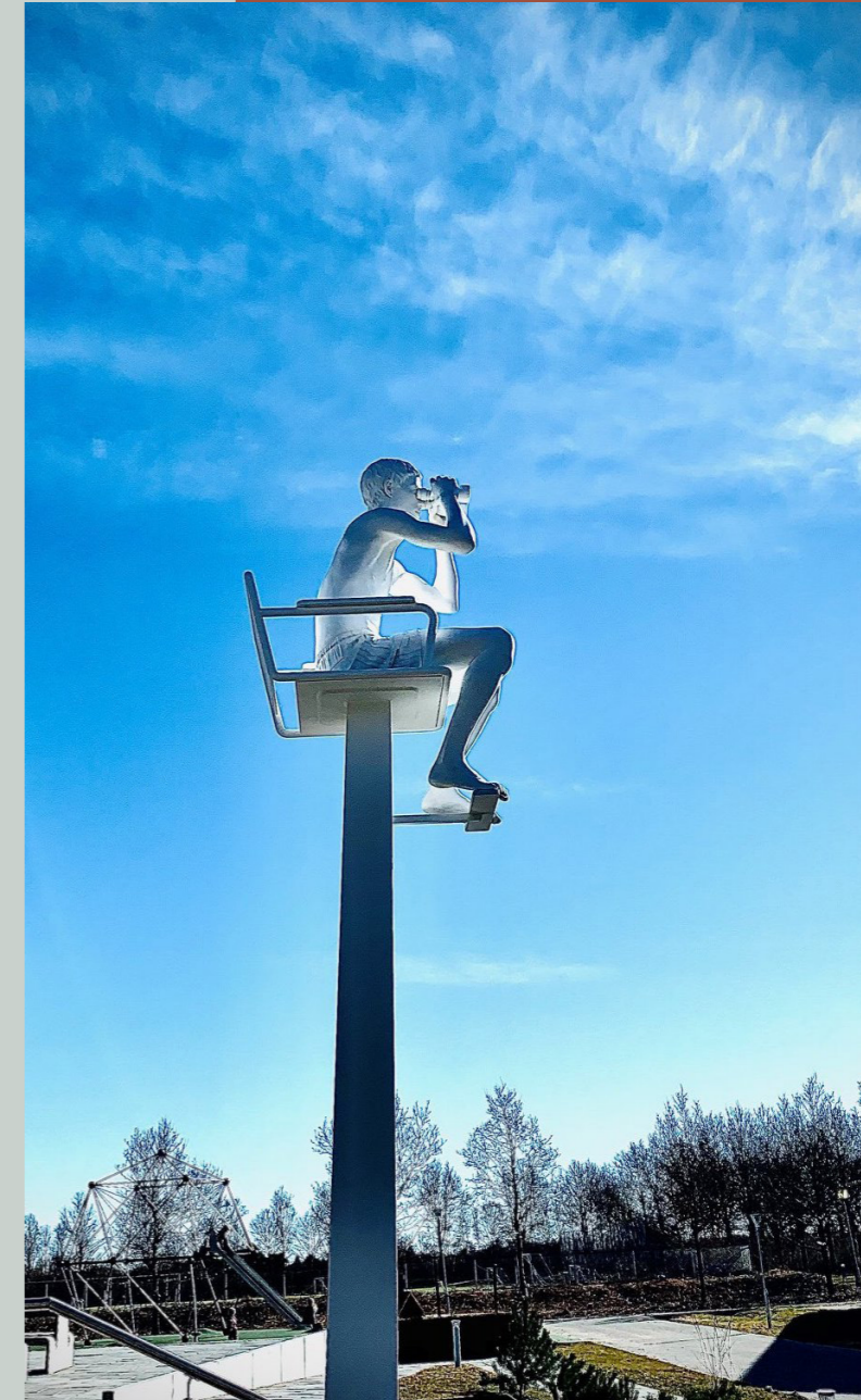
Elmgreen & Dragset, Livredderen , 2021, Vestamager Svømmehal

Det er vigtigt at kunsten forholder sig aktivt til havnemiljøet og omgivelserne, så det bliver en meningsfuld og integreret del af det eksisterende miljø. Kunsten bliver en del af fortællingen om Svendborg Havn, som rækker ud i byen og videre ud i verden.