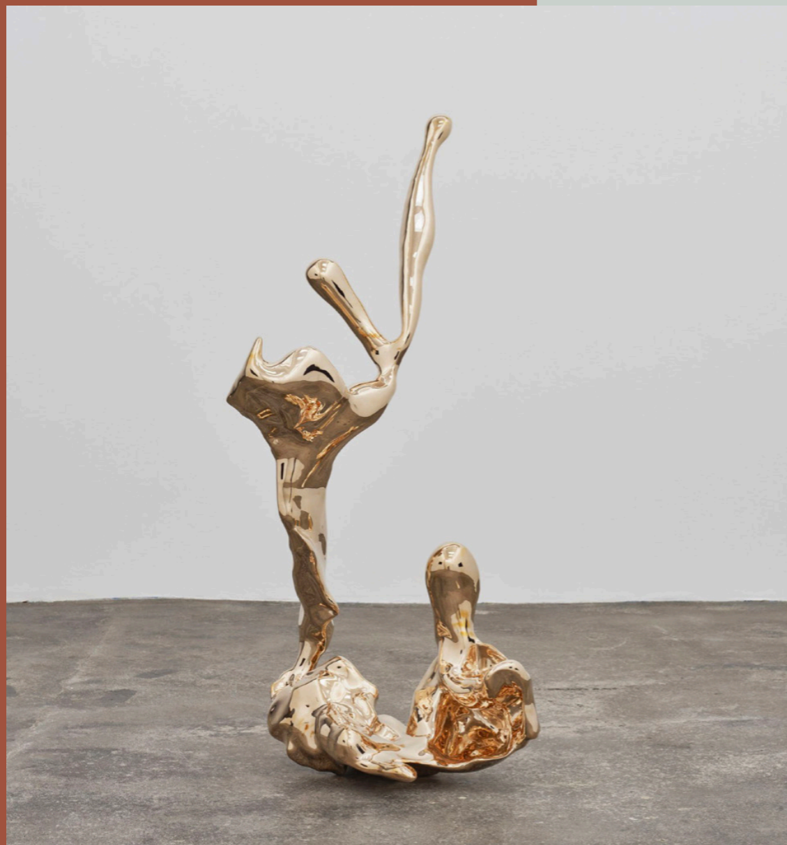
Værkeksempel: En "Bronze Pour" skulptur af kunstnergruppen A Kassen