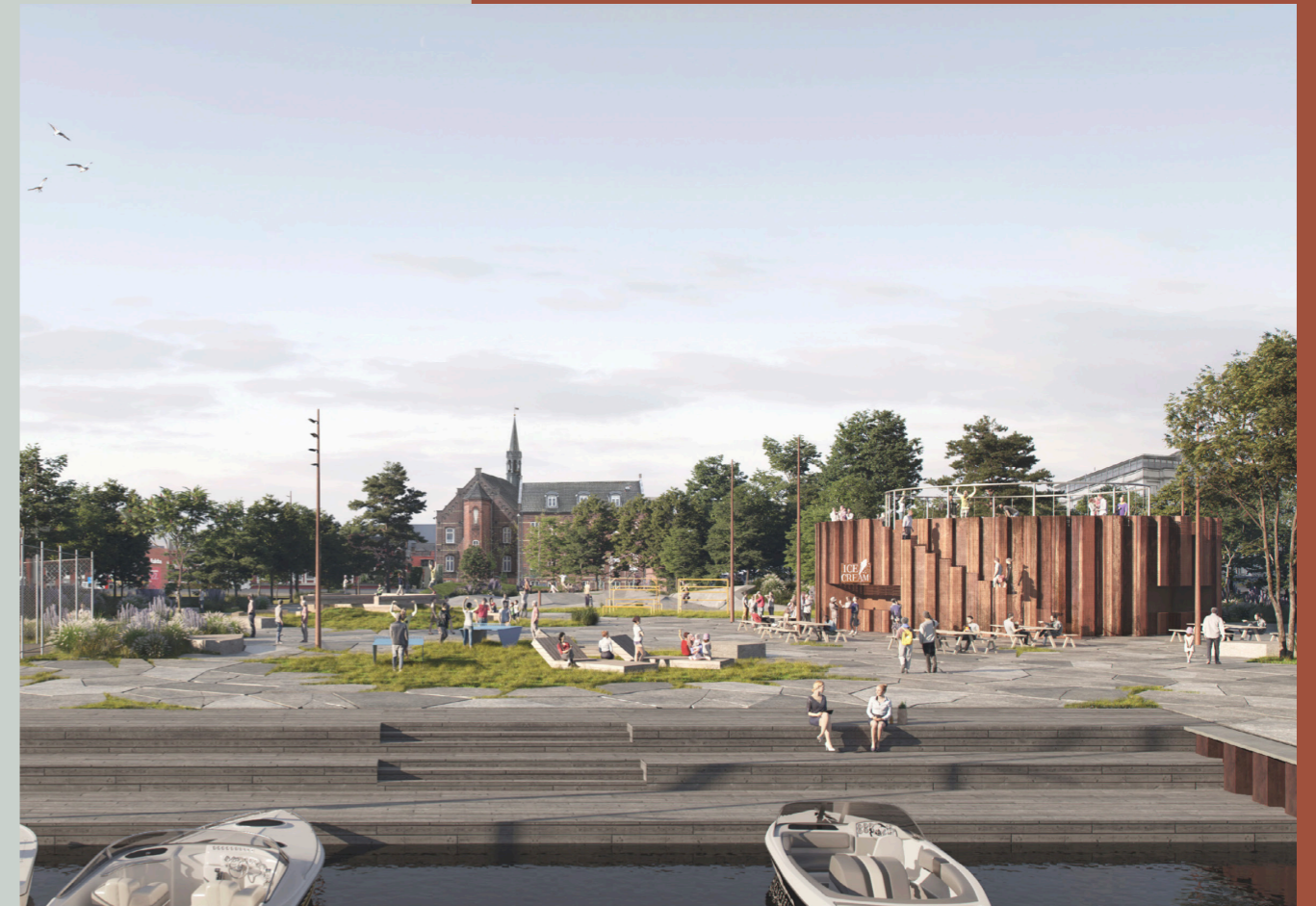
Pumpestationen i krydset mellem Nordre Kajgade og Nordre Havnevej