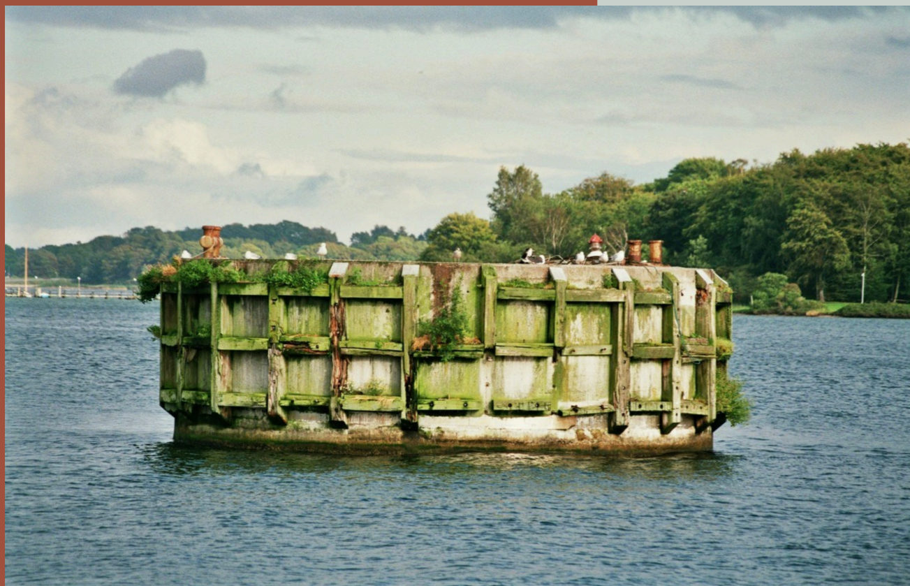
Duc d'albe ved Svendborg Havn

Det kan være relevant at lade kunsten fremhæve historiske steder, når en lokation bliver udvalgt. Et nedslag kunne være den runde duc d'albe ved den store flydedok eller i forbindelse med etableringen af en ny duc d'albe i Svendborg havn.